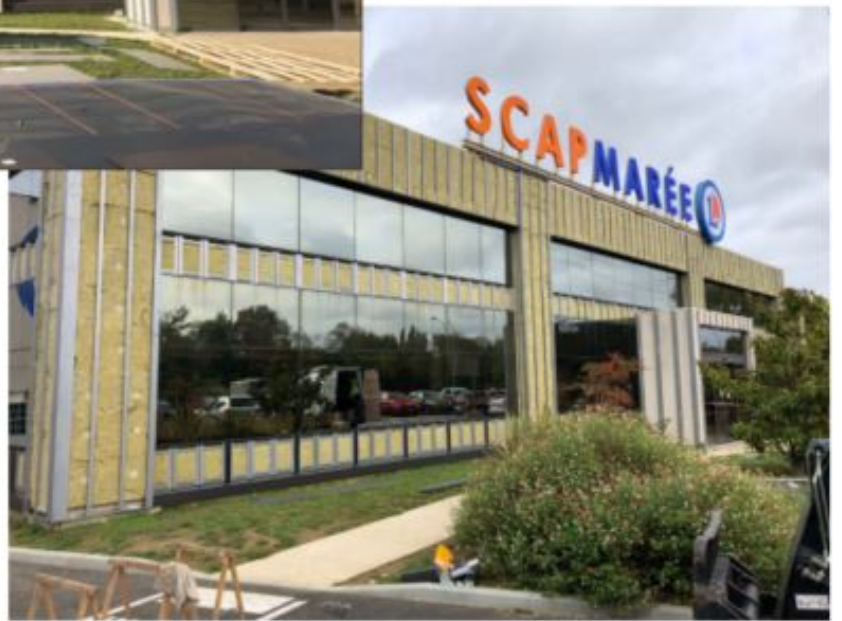
SCAP MAREE / E.LECLERC - Wissous (91) Extension et réaménagement des bureaux et locaux Réhabilitation et isolation thermique